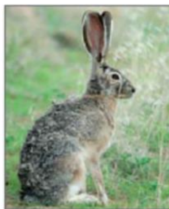
Zec je prilagođen boji tla